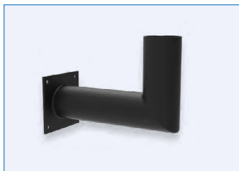
R59303 RENO-LSSM Tenon en équerre à montage mural – Tenon de 22,86 cm (9 po)